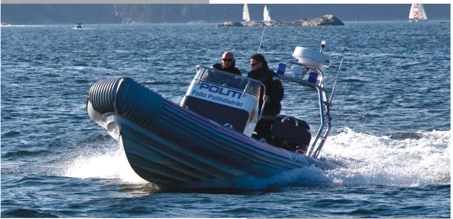
Tekst og foto: Jon Petter Andersen

Det er St. Hans aften, det er over gjennomsnittet godt vær og det er stor trafikk på sjøen! Undertegnede bretter ned all kalesje på båten, og bevæpnet med kamera og et par kalde Pepsi Max i kjøleskapet, rusler jeg over fjorden så sakte jeg kan.